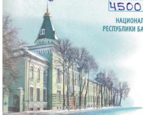
г. Уфа. Здание музея

НАЦИОНАЛЬНЫЙ МУЗЕЙ РЕСПУБЛИКИ БАШКОРТОСТАН 150 лет